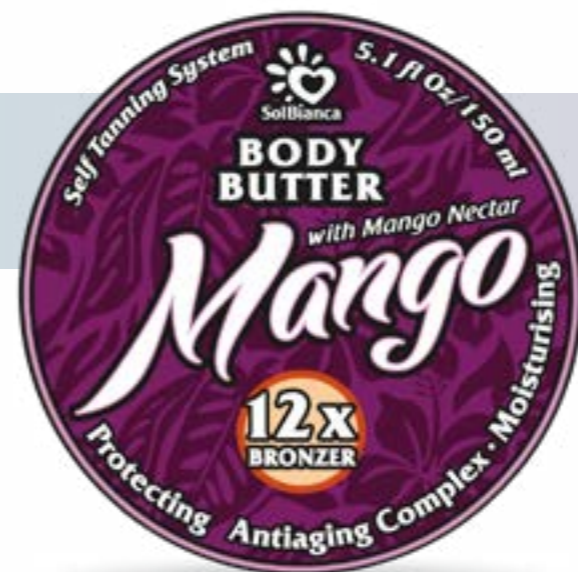
Арт. 8841-100 мл

Позволит приобрести насыщенный оттенок загара и сохранить молодость и здоровье Вашей кожи.